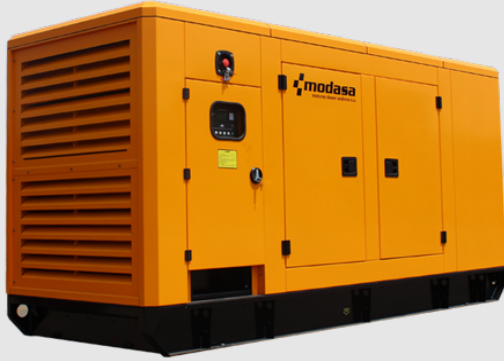
GRUPO ELECTRÓNICO INSONORO