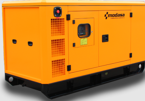
GRUPO ELECTRÓNICO INSONORO