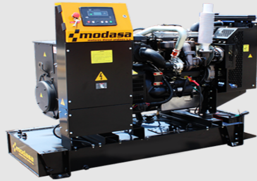
GRUPO ELECTRÓNICO ABIERTO

* Nota: Imágenes referenciales, pueden variar dependiendo de los accesorios